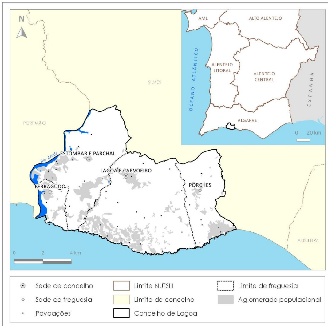
Figura 1. Enquadramento geográfico do concelho de Lagoa